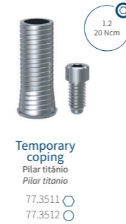
Temporary coping Pilar titânio Pilar titânio 77.3511 77.3512