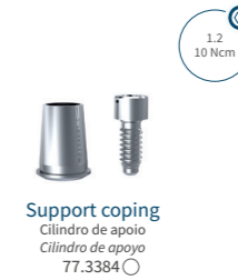
Support coping Cilindro de apoio Cilindro de apoyo 77.3384