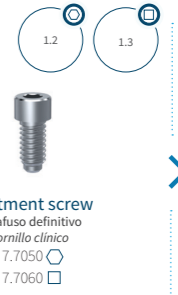
Abutment screw Parafuso definitivo Tornillo clínico 7.7050 7.7060