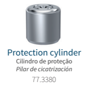
Protection cylinder Cilindro de proteção Pilar de cicatrización 77.3380