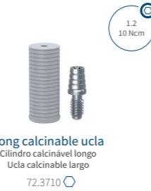
Long calcinable ucla Cilindro calcinável longo Ucla calcinable largo 72.3710