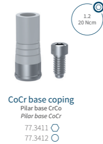
CoCr base coping Pilar base CrCo Pilar base CoCr 77.3411 77.3412