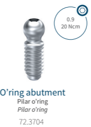
O'ring abutment Pilar o'ring Pilar o'ring 72.3704

* Capsule not included Capsule code: 2.4001 * Cápsula não inclusa. Código cápsula: 2.4001 * Cápsula no incluida. Código cápsula: 2.4001