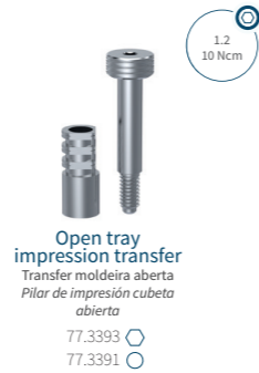
Open tray impression transfer Transfer moldeira aberta Pilar de impresión cubeta abierta 77.3393 77.3391