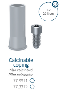
Calcinable coping Pilar calcinável Pilar calcinável 77.3311 77.3312