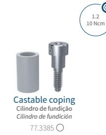
Castable coping Cilindro de fundição Cilindro de fundición 77.3385