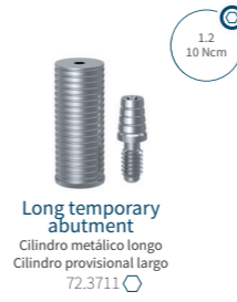
Long temporary abutment Cilindro metálico longo Cilindro provisional largo 72.3711