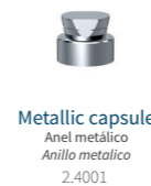
Metallic capsule Anel metálico Anillo metálico 2.4001

* Capsule not included Capsule code: 2.4001 * Cápsula não inclusa. Código cápsula: 2.4001 * Cápsula no incluida. Código cápsula: 2.4001