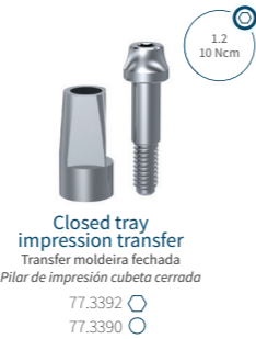
Closed tray impression transfer Transfer moldeira fechada Pilar de impresión cubeta cerrada 77.3392 77.3390