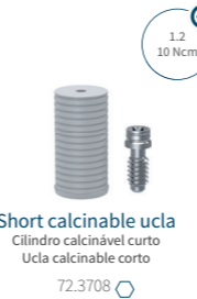
Short calcinable ucla Cilindro calcinável curto Ucla calcinable corto 72.3708