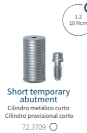
Short temporary abutment Cilindro metálico curto Cilindro provisional curto 72.3709