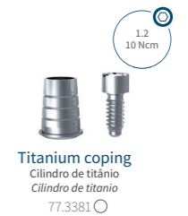
Titanium coping Cilindro de titânio Cilindro de titânio 77.3381