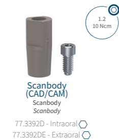
Scanbody (CAD/CAM) Scanbody Scanbody 77.3392D - Intraoral 77.3392DE - Extraoral