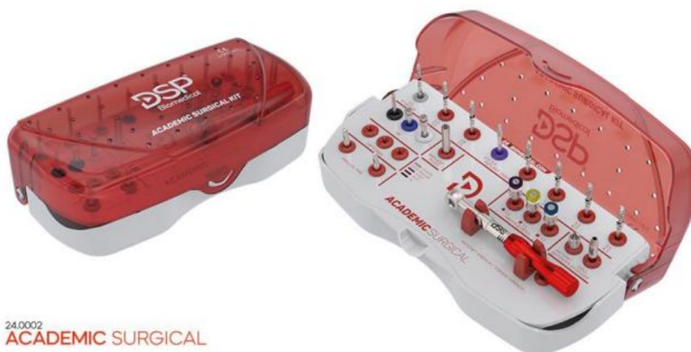
24.0002 ACADEMIC SURGICAL