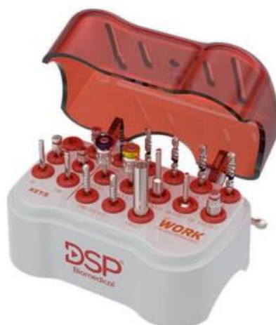
28.9001 KIT WORK